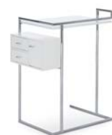
PETITE COIFFEUSE 1929