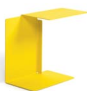
DIANA A 2002