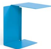
DIANA B 2002