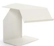
DIANA F 2002