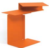
DIANA E 2002