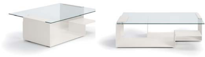
Cremeweiß creme white

Mesa auxiliar de chapa de acero, microestructura de laca pulverizada con placa de vidrio inastillable. Parte inferior recubierta de polietileno. Detalles y colores ver lista de precios.