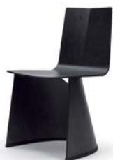
Schwarz gebeizt black varnished

Silla de madera cubierta de una lámina de madera real, barnizada y lacada. Acabado de las patas y asidero en goma. Detalles, colores y normas europeas probado ver lista de precios.