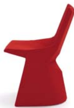
Divina rot red