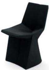
Sayonara schwarz black

Silla con asiento y respaldo acolchado. Pié de poliuretano rígido. Asiento de tubos de acero con poliuretano en diferentes densidades. Tapicería de tela o de cuero. Detalles y colores ver lista de precios.