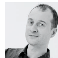
by Christophe Filloux

François Azambourg ist einer der Leader der französischen Bewegung des zeitgenössischen Wohnens. Fasziniert von der Idee des „Lichts als Materie“ schafft er suggestive und magische Objekte und verwendet dabei ungewöhnliche Techniken und robuste und gleichzeitig leichte Materiale. Die Sesselkollektion zum Beispiel enthält Elemente aus einfachem Metall, die durch die Verbindung mit dem internen PU-Schaum und dem „Knittereffekt“ der Oberflächen unheimlich interessanter werden.