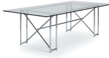
Kristallglass crystal glass