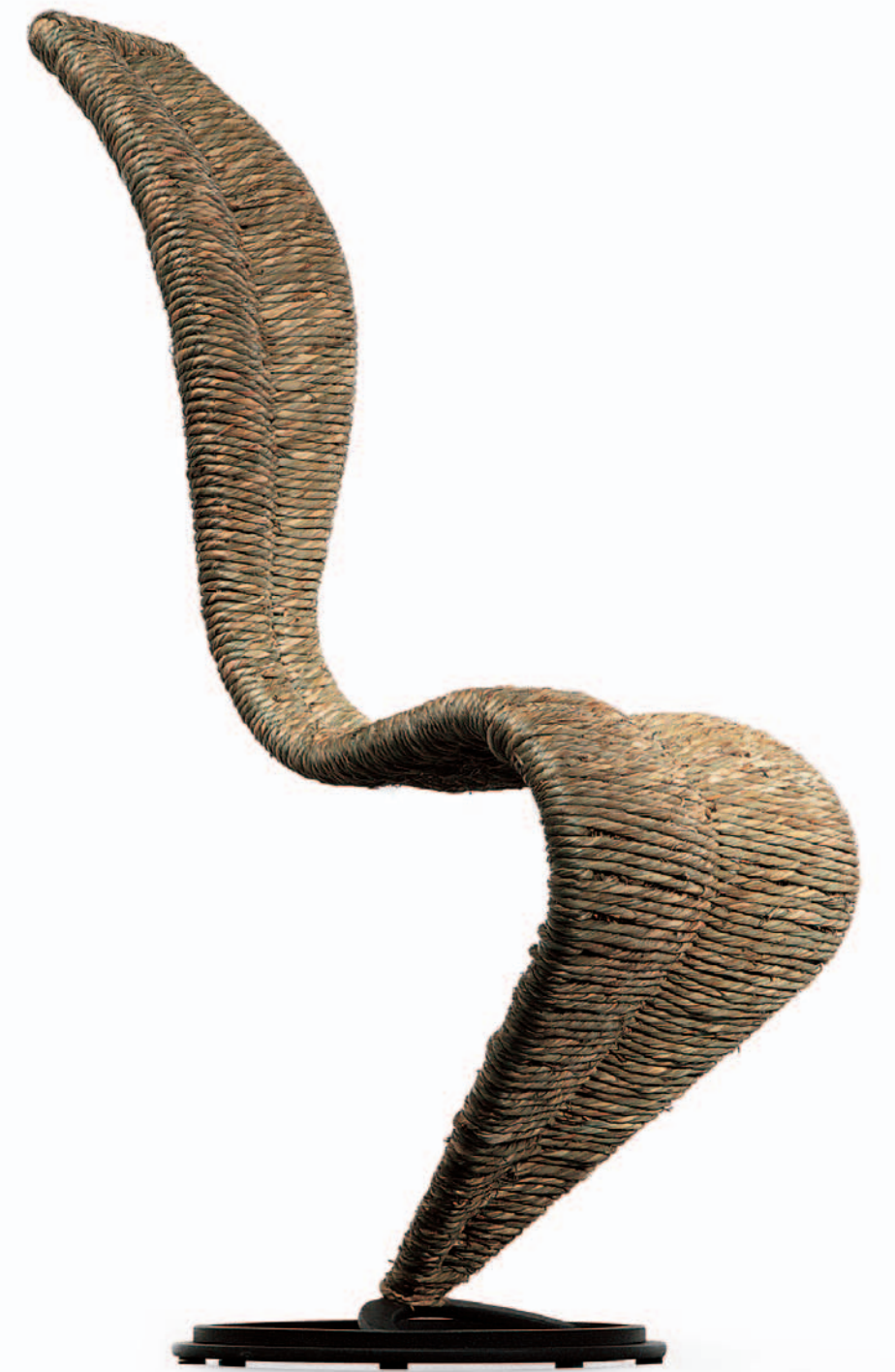
S-CHAIR Tom Dixon 1991/1992