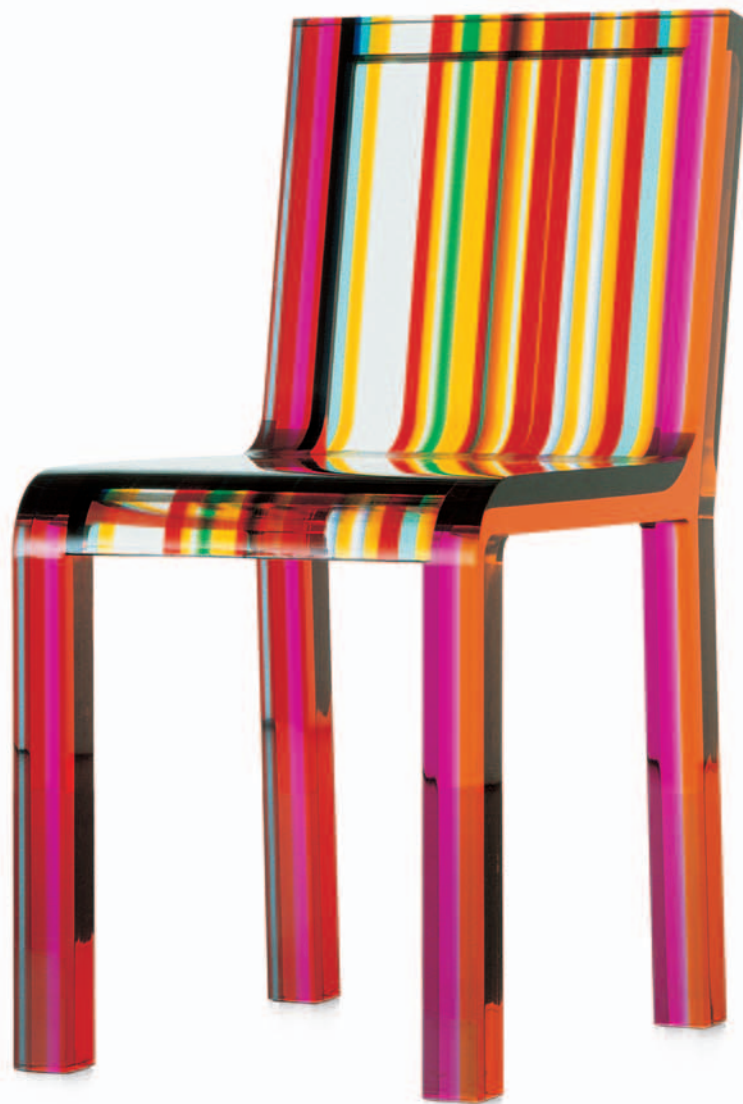
RAINBOW CHAIR Patrick Norguet 2000