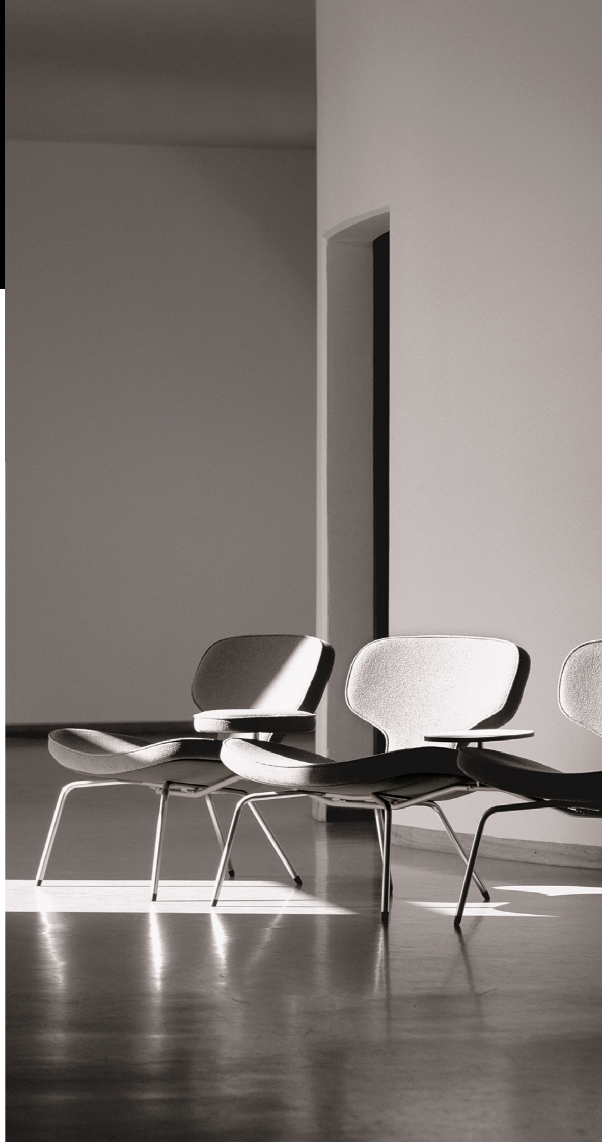
F 230 Libel